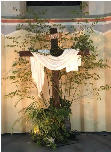
Platz 1: ohne Titel (Beate Mika)

Wir freuen uns, Ihnen die Gewinner-Fotos für den April-Pfarrbrief präsentieren zu dürfen: